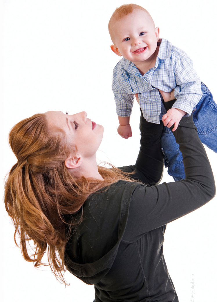
Mit Muttermilch ist Ihr Kind auch in der Kita gut versorgt.

Für den Transport der Muttermilch eignet sich eine leicht zu reinigende Kühltasche mit mehreren Kühlelementen, die Sie im Gefrierschrank lagern. Die Tasche und die Kühlelemente sollten Sie nach jeder Nutzung säubern.